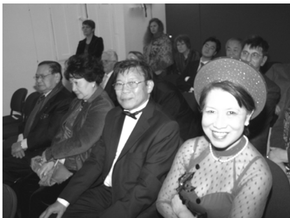
Ngày trình diễn tại Hàn Lâm Viện Âu Châu (28 tháng 11 năm 2009)