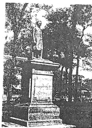
Tượng Petrus Ký trước Dinh Độc Lập

Một tin vui nữa: Cái tượng Petrus Trương